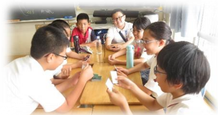
三校の児童同士の交流