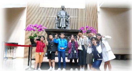
台湾 東華大学附設実験小学校訪問