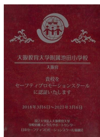
S P S 認証楯