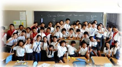
陳守仁小学校・東華大学附設実験小学校来訪